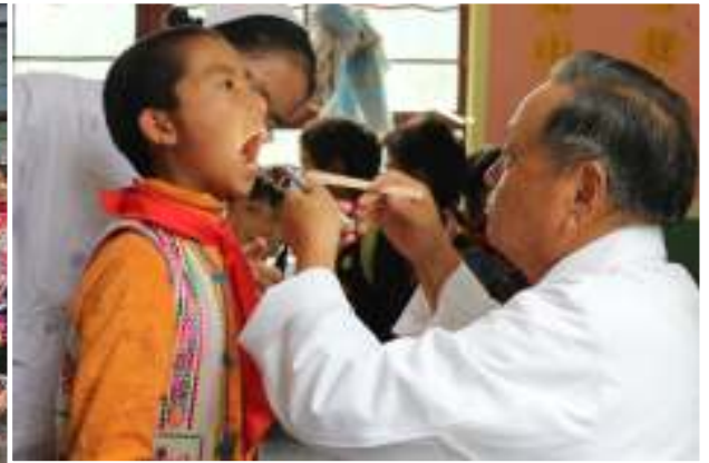
上:2011 年度初めての試みとなった支援校児童健康診断の様子