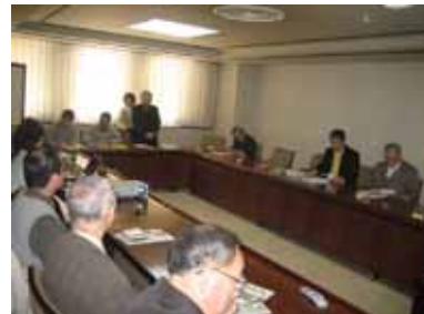
国学院大学で行われた、民俗経済研究会では、独龍族を紹介しました