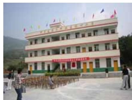
第15校目木杆小学校（ミャオ族）