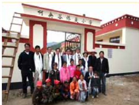
第14校目阿央谷小学校開校式