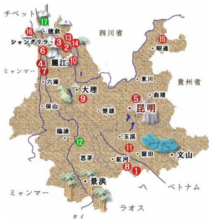
中国雲南省小学校開校・建設状況図