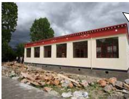
チベット族建築様式の美しい新校舎