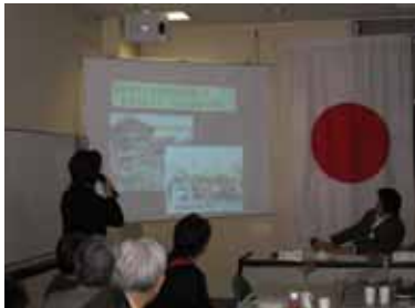
たまがわロータリークラブにて雲南の現状を話しました