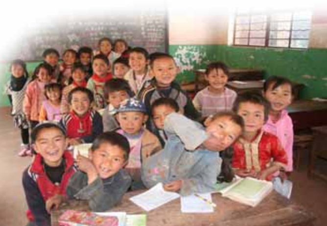
2008年度建設支援候補校に通う、元気いっぱいイ族の子どもたち 生えかわり