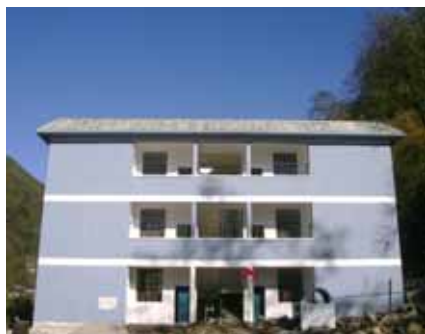
第16校目巴坡小学校は独龍族の学校