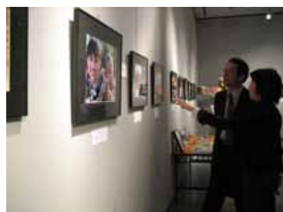
雲南省曲靖市宣伝&友好交流会（9/10）/世界へ未来へフェスティバル（9/29）/第一回初鹿野恵蘭写真展（4/16～22）