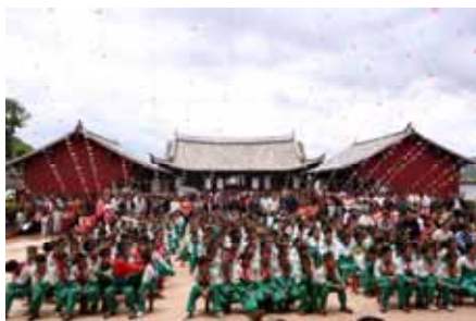
第11校目白雲小学校開校式にて