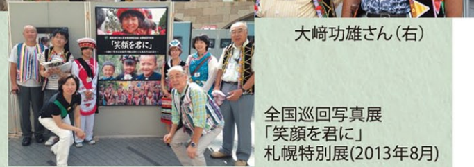
全国巡回写真展「笑顔に君に」札幌特別展(2013年8月)

私の出会った少数民族の子たちはみな家族のこと、故郷の発展のこと、自分が受けた教育機会のこと、そして将来の夢について手紙の中で綴ってくれました。いつかこの子たちの夢を追いかけている自分に気づいたものです。そしてまた、この子たちの中に生きることが自分の夢であることにも気づきました。個人の生は有限ですが、その夢や思いは他者の中に引き継がれ脈々と生き続けます。出会いとは希望を繋いでいくバトンタッチのようなものです。日本雲南聯誼協会との出会いは「人間らしく生きる」という私の希望を繋いでくれました。その協会は来年創立20周年を迎えます。ますますの発展をここに祈り、筆を置きます。