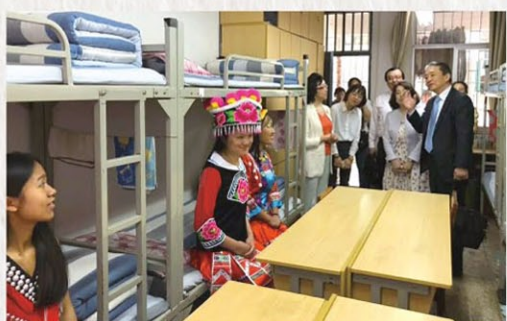
学生寮を訪問し春蕾生を励まされました

また、地元政府や財界等の方々にお招きいただき、貴重な意見交換をさせて頂きました。大変有意義で参考になりました。大変美味しい地元の料理も沢山いただきました。自然の恵みである果物やきのこ等の農産物が豊富で、松茸やトリュ