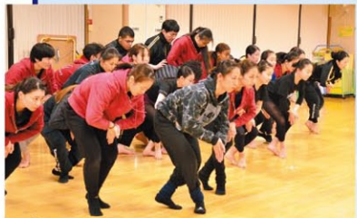
練習は真剣そのものです

お約束の時刻。練習場のドアを開けた途端、軽快にリズムを刻む手拍子と明るいテノールの声が耳に飛び込んできました。大いに緊張して中へ入ると、指導待ちの生徒のみなさんが三々五々柔軟体操をしたり、振り付けの練習をしたり、まるで舞台裏のような雰囲気。そこはかたなく熱気が伝わってきました。