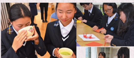
▲茶道初体験の春蕾生