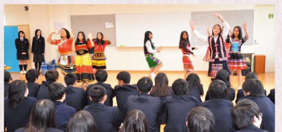
▲それぞれの民族衣装で踊りを披露