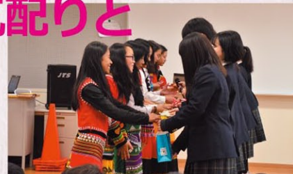
▲すぐに友達になりました

最も印象深かったのは上海日本人学校での交流でした。校門を入るとすぐに広々としたキャンパスと清潔な地面が目を引きました。まだ日本に行ったことがないのに日本の清潔な環境を感じました。生徒たちが通路をはさんで私たちを