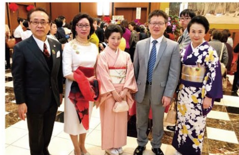
右から2人目、詹孔朝中国大使館総領事(夢基金会員)

2月27日の夜、3月8日の「国際婦人デー」を祝う中国大使館主催「2019年国際婦人デーパーティー」が今年も催され、日中各