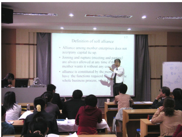
村松先生の講義の様子

この経営工学セミナーは、中国の学生がより実践的な知識を深め、次世代の社会作りにつながれば、という日本側の先生方の思いで今回も実現することができました。