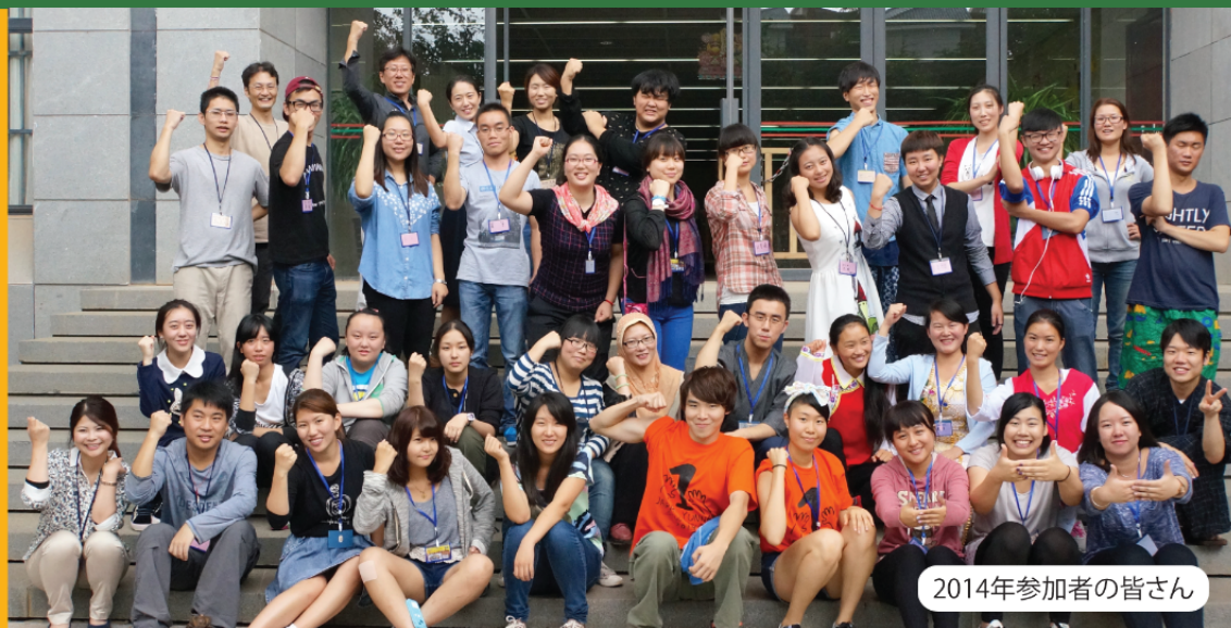
2014年参加者の皆さん

「アジアの未来へ貢献したい」と考えている大学生のあなた。ミャンマー、ベトナム、ラオスに接する少数民族の国、「雲南省」で地元大学生と共に貧困農村に宿泊し現地住民や小学生と交流しながら発展途上地域が抱える社会問題を考える実体験プログラムです。